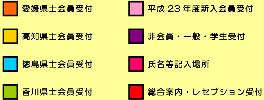
カメラリアホール1階